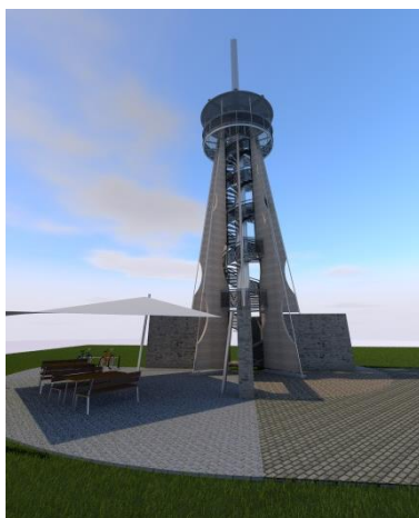
Rozhledna / Wieża widokowa Jeseník nad Odrou (vizualizace)