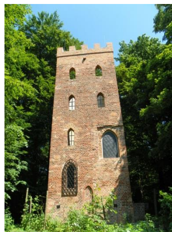
Rytiřská bařta / Baszta rycerska Wodzisław Śląski (před rekonstrukcí)